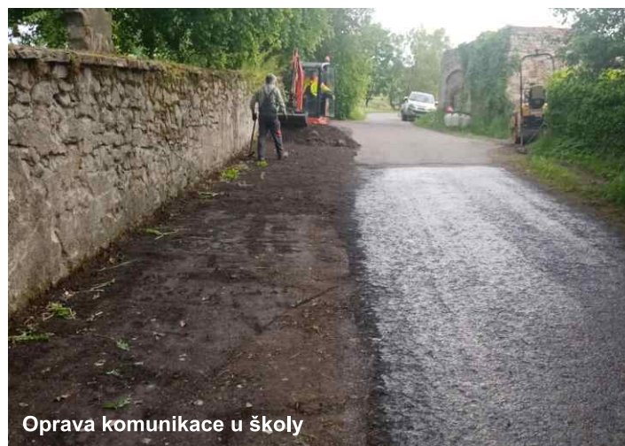
Oprava komunikace u školy