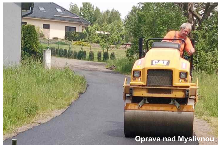
Oprava nad Myslivnou