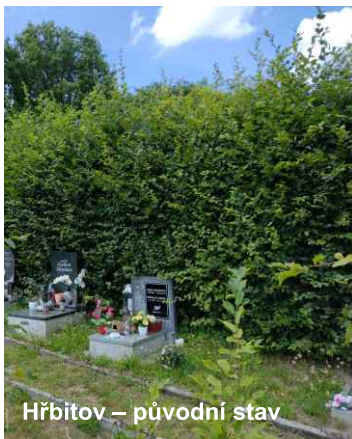
Hřbitov – původní stav

V průběhu září budou instalovány další dvě autobusové čekárny. Jedna na Mlýnici (konečně!) a jedna ve spodní části obce u č. 11 (také konečně!) před odbočkou na Růžek. Další budou následovat. Evidentně se nám podaří vyřešit problém z minulosti.