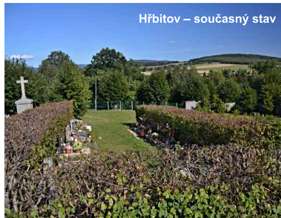
Hřbitov – současný stav