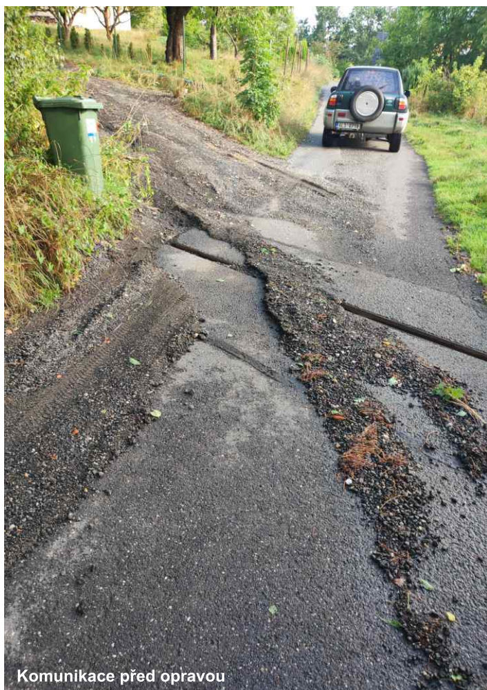
Komunikace před opravou