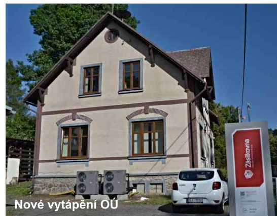
Nové vytápění OÚ