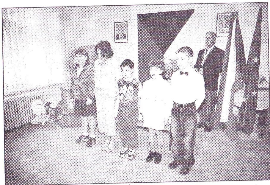
Fotografie z vítání jsou na CD k dispozici na obecním úřadu nebo v Chrastavě na náměstí v atelieru paní Zahurancové.

♣ Na 30. dubna připravili členové Sboru dobrovolných hasičů vatra s pále-